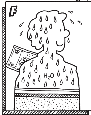
F 68% Wasser 20% Kohlenstoff 6% Sauerstoff 2% Stickstoff 4% Aschenbestandteile Wert = ca. 10,- EUR