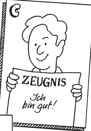
Der Mensch ist gut. (Humanismus)