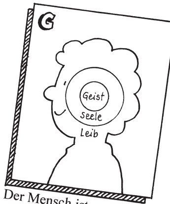
G Der Mensch ist eine Einheit aus Geist, Seele und Leib