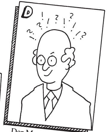
D Der Mensch ist eine denkendes Wesen. Er kann alles erkennen.