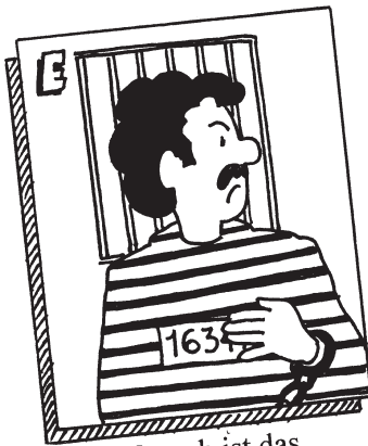
E Der Mensch ist das, was die Gesellschaft aus ihm macht.