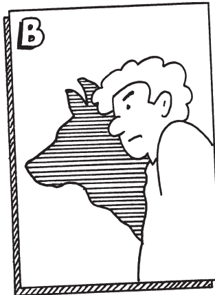
B Der Mensch ist des Menschen Wolf. (lat. Sprichwort)